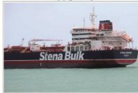
آیا توقیف نفتکش انگلیسی در تنگه هرمز قانونی است؟