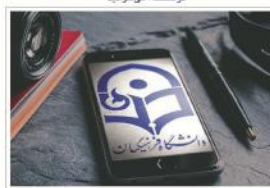
هر آنچه که می‌خواهید در باره ی