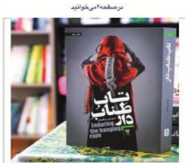
کتاب و فرصت خوب مطالعه با جاشی «قاب طناب دار»