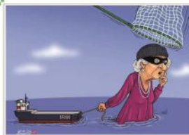
تمام قد مقابل روپا

چند روز پیش دولت آمریکا وزیر خارجه کشورمان را تحریم کرد. ضمن محکوم کردن این اقدام آمریکا سخنی داریم با وزیر خارجه کشورمان. آقای ظریف به یاد دارید که شما و آقای روحانی چقدر به آمریکا و مذاکره خوشبین بودید؟ در تمام این سالهایی که منتقدین، سابقه جنایات و بدعهدی آمریکا را به شما یادآوری می‌کردند، شما دلخوش به مذاکره با آمریکا بودید و منتقدین را با توهین‌هایی چون ترسو، بزدل، بی‌شناسنامه و بی‌سواد مورد نوازش قرار می‌دادید! آقای ظریف! یادتان هست که برای اولین بار پس از انقلاب، با «شیطان بزرگ» قدم زدید و عکس گرفتید؟ یادتان هست که به امضای «شیطان بزرگ» اعتماد کردید؟ یادتان هست که در برابر وعده‌های دشمن، همه تعهدات‌تان و بیشتر از آن را نقداً انجام دادید؟ یادتان هست که امام خاندای همچون پدری دلسوز فرمودند «به دشمن اعتماد نکنید. خرس از پل بگذرد، برمی گردد و به ریش شما می‌خندد»، فرمودند من به مذاکره خوشبین نیستم». اما آقای روحانی پاسخ دادند «در دنیای سیاست خوشبینی و بدبینی معنا ندارد» آقای ظریف! در برابر آمریکا باید پیشروی کرد، نه عقبگرد. همان طور که ایستادگی و پیشروی چهل ساله نیروهای نظامی کشورمان در برابر نیروهای تروریستی آمریکا و غرب، وادادگی و عقبگرد این نیروهای تروریستی و متحدین آنها را در پی داشته است. آقای ظریف! آمریکا همین است؛ متکبر و غیر قابل اعتماد. نه «تیم B» متفاوت از جمهوری خواهان است و نه جمهوری خواهان متفاوت از دموکرات‌ها... راستی مگر جز خندیدن به شنیدن این خبر استراتژی دیگری دارید؟؟؟ شورای سردبیری