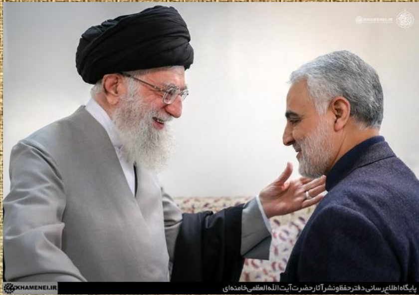
پایگاه اطلاع‌رسانی دفتر حفظ و نشر آثار حضرت آیت‌الله العظمی خامنه‌ای

سردار شهید قاسم سلیمانی نمونه‌ی برجسته‌ای از تربیت‌شدگان اسلام و مکتب امام خمینی بود. او همه‌ی عمر خود را به جهاد در راه خدا گذراند. شهادت پاداش تلاش بی‌وقفه‌ی او در همه‌ی این سال‌ها بود. ۱۳۹۸/۱۰/۱۳