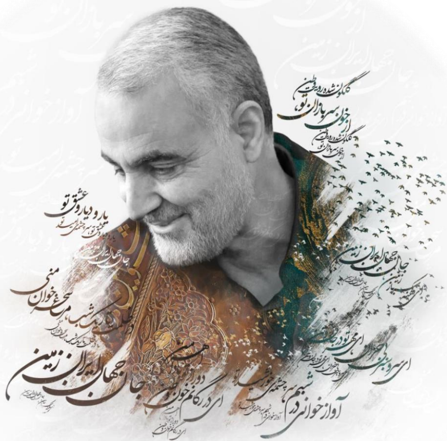
PERSIAN GENERAL GENERAL SOLEIMANY