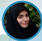
کارشناسی آموزش ابتدایی