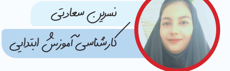
نسرنج سعادت کارشناسی آموزش ابتدایی